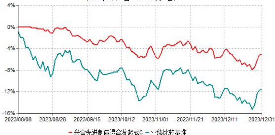
兴合先进制造混合发起式C累计净值增长率与业绩比较基准收益率历史走势对比图 (2023年08月08日-2023年12月31日)

注：1、本基金建仓期为基金合同生效日起的6个月。截止本报告期末，本基金尚未完成建仓。